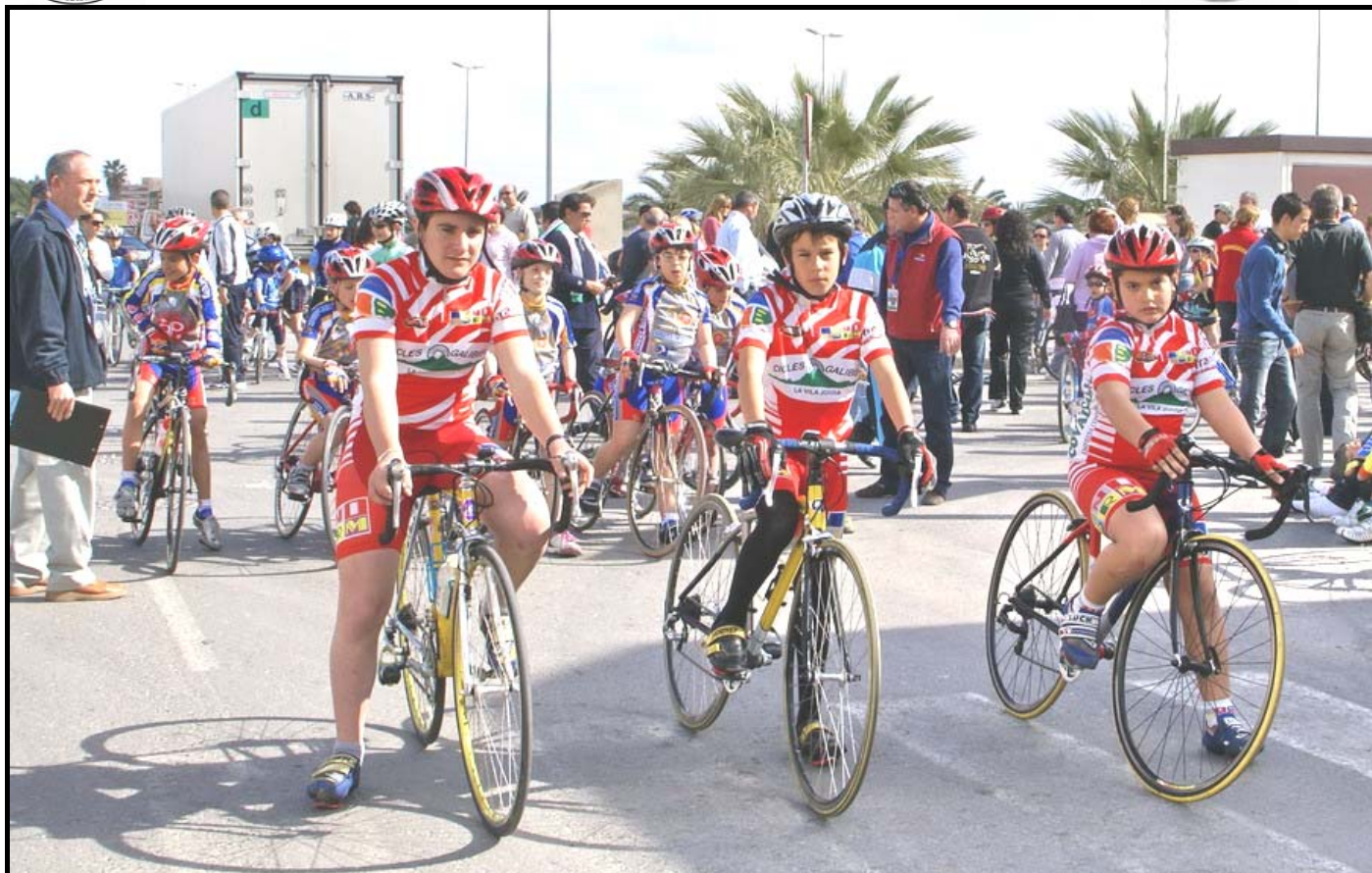
CC Sol Benidorm